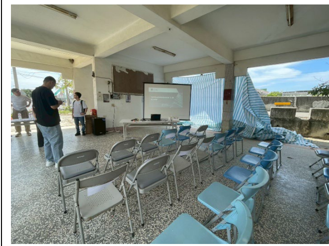
圖一、說明會前場佈