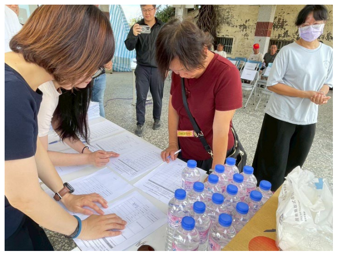
圖二、各機關單位及民眾報到