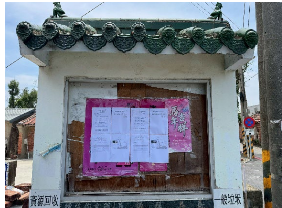
北華村村辦公室公告