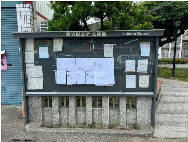
嘉義縣義竹鄉公所公告