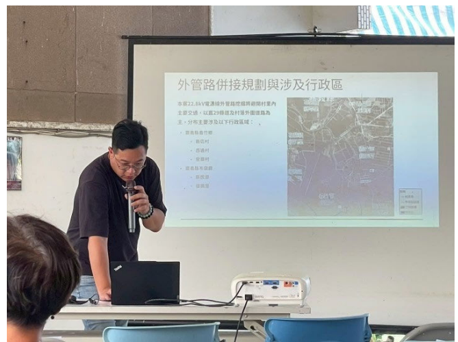
圖四、案場規劃及工法說明