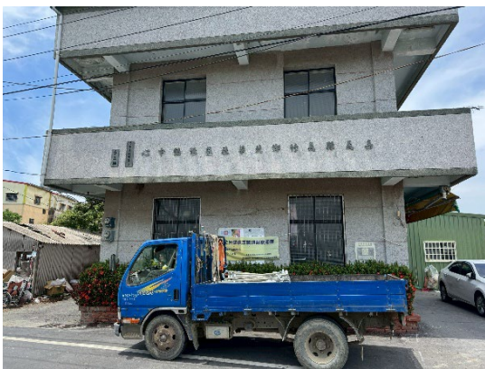
北華村活動中心公告