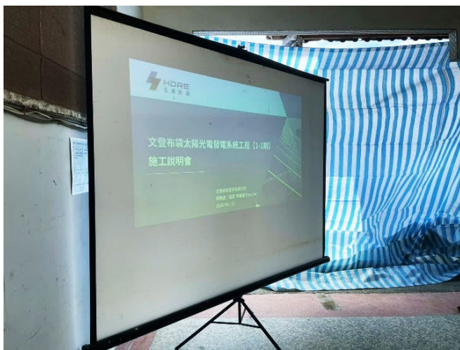
圖三、說明會主題簡報