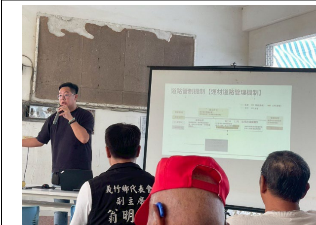
圖五、交通維管說明