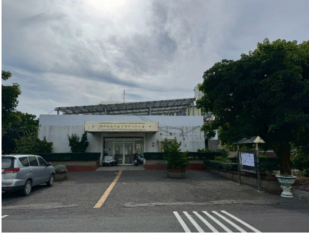
嘉義義竹工作站公告