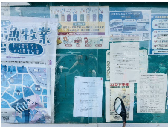
新店村社區活動中心公告