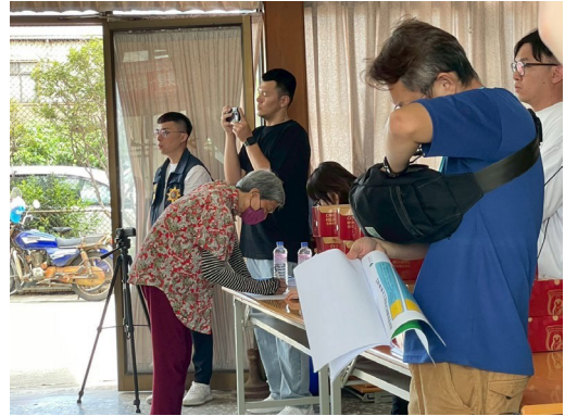
圖二、各機關單位及民眾報到