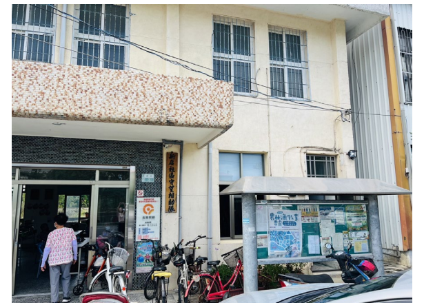
新店村社區活動中心公告