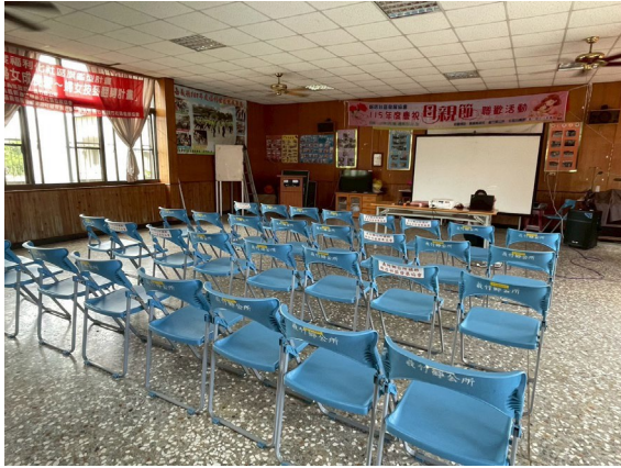
圖一、說明會前場佈