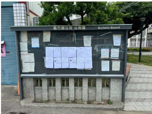
嘉義縣義竹鄉公所公告