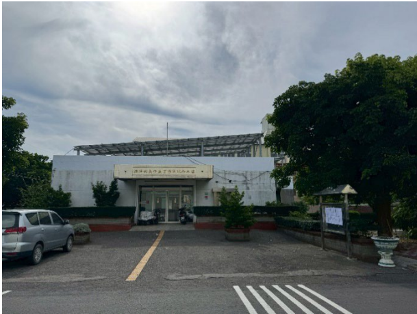
嘉義義竹工作站公告