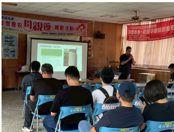
圖五、交通維管說明