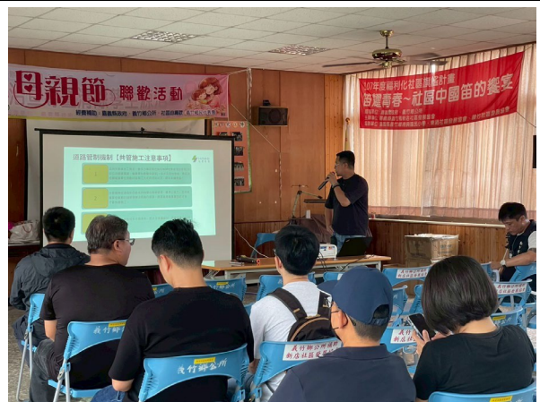
圖四、案場管路規劃說明