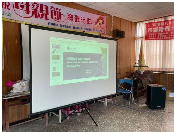
圖三、說明會主題簡報